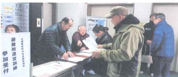
避難者の受付訓練

昨年の大きな災害を踏まえて、連絡協議会防火防災部「避難所運営」訓練を実施しました。 昨年11月25日、北郷会館で午前10時から開始。第5町内会からも役員6名が参加しました。 訓練は各町内会防火防災部役員が主体となり、地域の一時避難所に指定されている北郷会館にて実際の災害時を想定して実施されました。避難者の名簿作成、誘導、避難場所設営、物資の準備、食料の配布、高齢者の対応など各班に分かれて行われました。 東部胆振地震で北海道全域が停電になり今後の課題となりましたが、屋外で発電機を稼働させて避難所に電気を送り暖房器具を使用するなど新しい試みもありました。