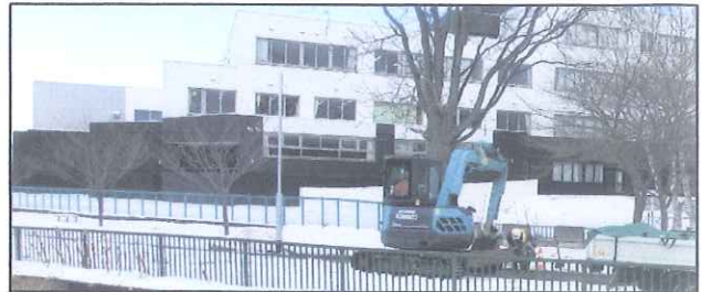
街灯ポールの取付作業