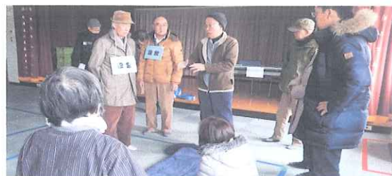
寝袋を使っでの就寝体験と意見交換