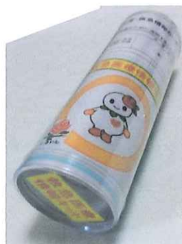
救急医療情報キット

災害・救急情報カードとシールが各2枚透明な筒の中に。カードに内容を記載して自宅冷蔵庫に保管。緊急の際持病や服薬内容を伝えることができる。