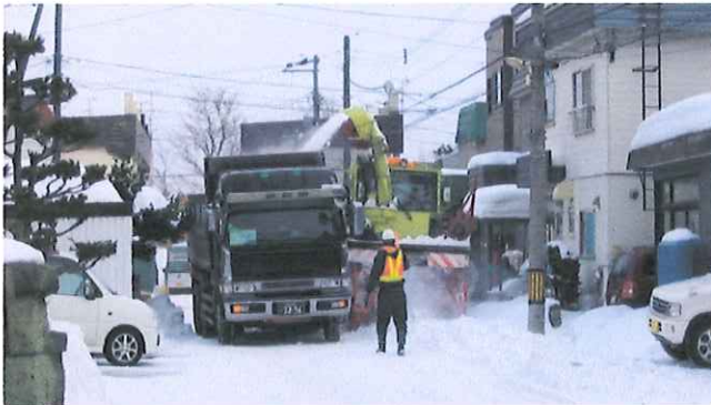
道幅の狭い生活道路の除排雪

作業業者は㈱松平産業で、当日町内会から男性役員が通行人の安全誘導、路上駐車移動のお願いなどを行います。尚、当日はご家庭からの雪出し、除排雪時間帯に路上駐車をしないようお願い致します。