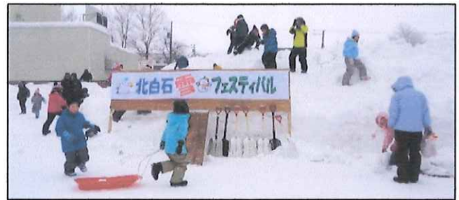
雪フェスティバルの風景