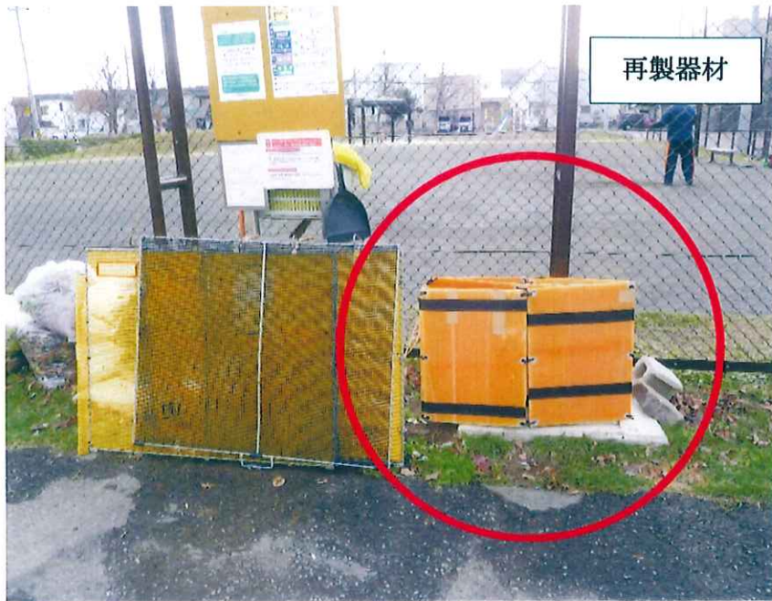
再製補助機材現況写真 (丸印)

令和2年10月下旬頃から11月2日迄の期間に第4町内区域（北郷4条2丁目16もくれん公園近接）に設置している、ゴミ St の補助機材（PEカラネット）が、心無い愚か者に盗まれました。利用者から、カラスが溢れたゴミ袋に群がり、食い散らかしていると、近隣住民が迷惑を被っていますと町内会に苦情・相談があり、町内会と利用者でカラスよけサークル板（中空ポリプロピレン）で再製・設置しました。このような盗み行為は犯罪です。損害を受けた町内会・利用者が大変迷惑千万です。