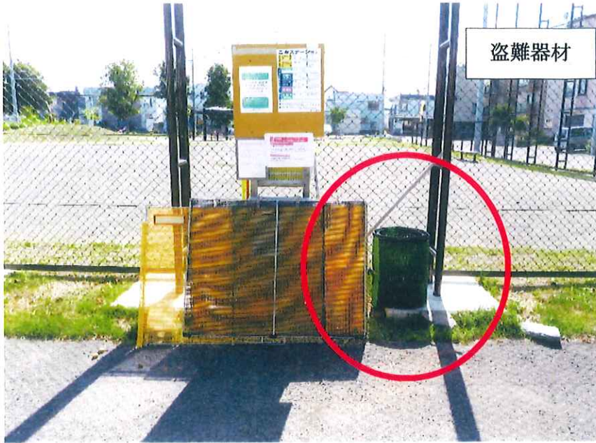
盗難前補助機材 (写真右側丸印)