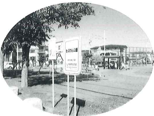
もくれん公園全景

自動車は勿論バイク、自転車等雪の中に埋もれて除排雪作業の支障にならないように充分注意しましょう。