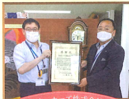
札幌オーナーズ株式会社 様