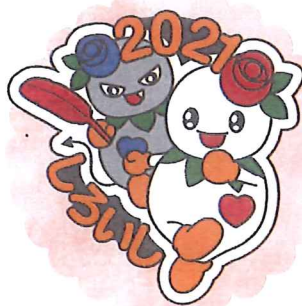
白石区限定 しろっぴーバッジ [500円]

各グッズにつきましては、数に限りがありますので、ご希望の方はお早めにお問い合わせください!!