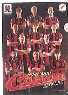
北海道コンサドーレ札幌のクリアファイル [300円] と 北海道日本ハムファイターズの缶バッジ [200円]