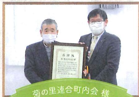
菊の里連合町内会 様