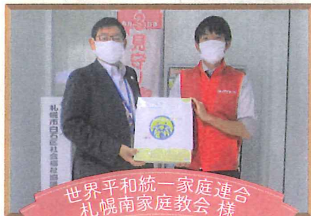
世界平和統一家庭連合 札幌南家庭教会 様