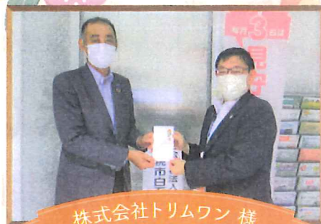
株式会社トリムワン 様

ご寄付いただいた寄付金や寄付物品につきましては、白石区内の地域福祉活動者及び集いの場や本会窓口などに設置し来所者へ配布するなど、地域の皆様に活用していただいております。