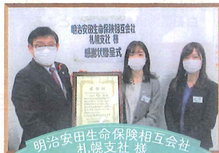
明治安田生命保険相互会社 札幌支社 様