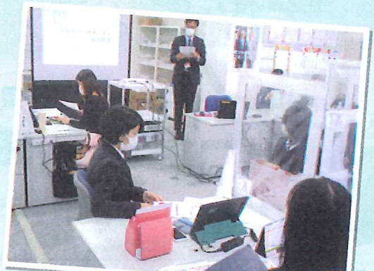
「地域見守りサポーター養成研修」の様子

札幌白石営業所様からのご依頼で、気になる高齢者のちょっとした見守り活動を学ぶ「 地域見守りサポーター養成研修 」を受講いただきました!