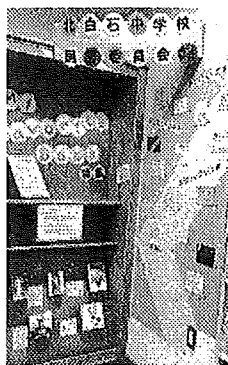
昨年の展示の様子

昨年に引き続き、北白石中学校図書委員会のみなさんが作って中学校で展示していたオススメ本のポップを、地区センター図書室で展示することになりました！ 今どきの中学生はどんなことに興味があり、どんな本を読んでいるのでしょうか？楽しみですね♪ 一月中には展示を始められる予定なのでぜひチェックしてみてください。