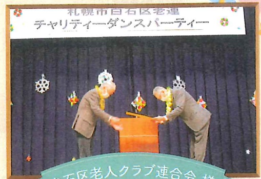
白石区老人クラブ連合会 様