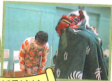
獅子による頭カミカミ いい年になりますように