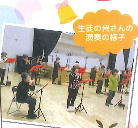
生徒の皆さんの演奏の様子