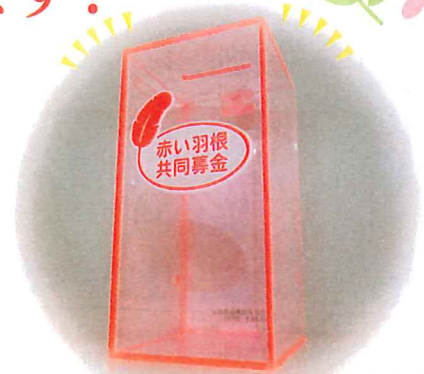
募金箱 縦 10cm、横 10cm、高さ 20cm

10月～3月までの共同募金運動期間に関わらずご協力いただきますようよろしくお願いいたします。