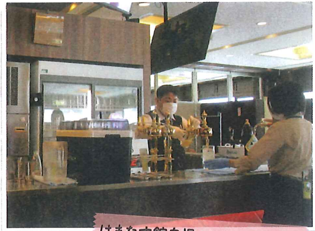
はまなす館自慢のビアカウンター

今回は、白石では誰もがご存じのアサヒビール園白石はまなす館さんとロイン亭さんにお邪魔しました。