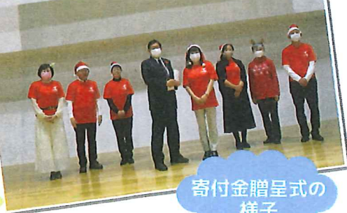
寄付金贈呈式の様子