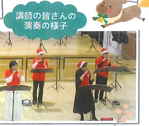
講師の皆さんの演奏の様子