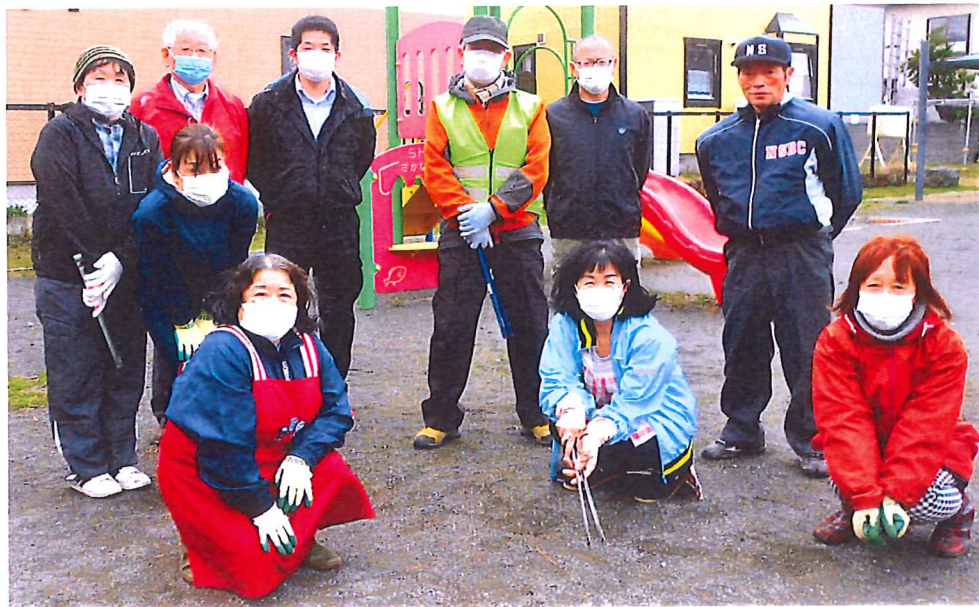
今年もなかよし公園の清掃・草刈が始まりました