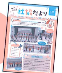
しろいし区社協だより

※なお、ご寄付いただいた募金は、白石区の活動のほか、全道・全市の福祉団体等にも助成されております。