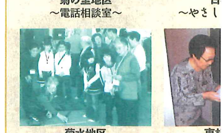
菊水地区 ～お年寄りと子どもの交流会～