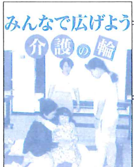
みんなで広げよう 介護の輪