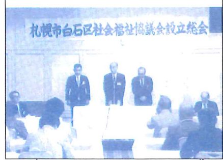
札幌市白石区社会福祉協議会設立総会