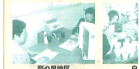
菊の里地区 ～電話相談室～