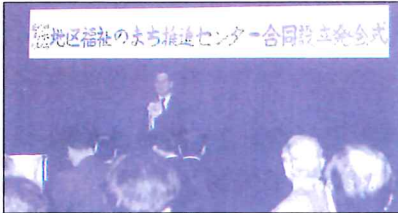
'96年「第17号」 '96年～98年にかけて 各地区に福祉のまち推 進センターが設立され ました。