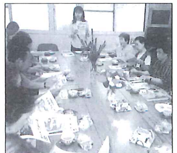
'01年「03秋号」 ふれあい・いきいきサロン モデル助成事業開始以降、 多くのサロンが開設されま した。