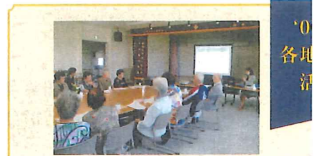
北白石地区 ～北郷ふれあい・いきいきサロン～