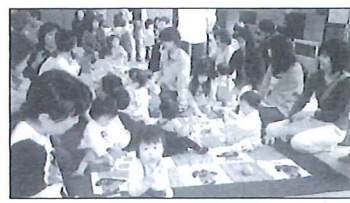
'91年「第4号」 '90年度より在宅福祉の 推進目的で老人介護講座 を開催しました。