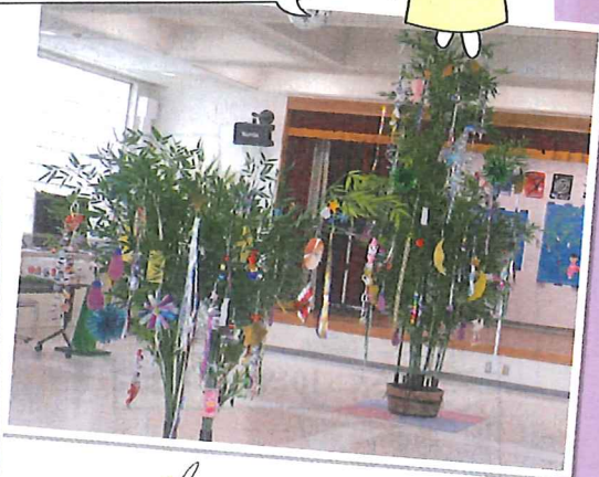
笹の葉と七夕飾りがもらえます!