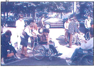
'98年「第27号」 在宅支援の要請が増えてきたことを背景に3級 ヘルパー資格取得ボランティア養成事業を 開始、講座を開催しました。