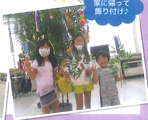
家に帰って飾り付け!