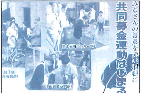
みなさんの善意を赤い羽根に 共同募金運動はじまる