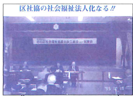
区社協の社会福祉法人化する!!