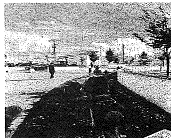
環境委員会の前庭花壇の手入れの活動の様子