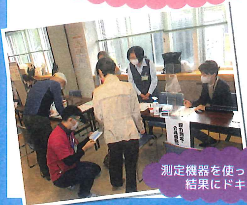
測定機器を使った測定会! 結果にドキドキ...