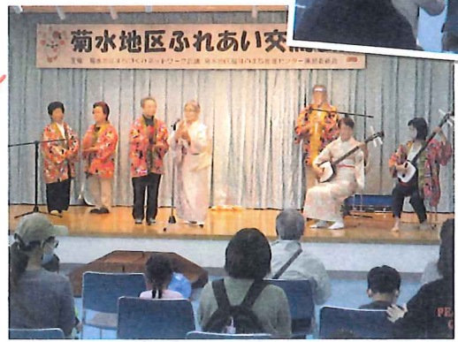
当日は しろっぴーも 来ていたよ!