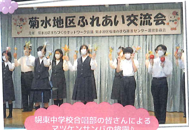
幌東中学校合唱部の皆さんによる マツケンサンバの披露♪

縁日や健康チェックコーナー、音楽祭など盛りだくさんの内容でした。当日の天気はあいにくの雨模様でしたが、約250名の方が来場されたそうです。