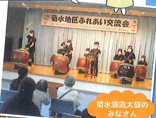
菊水源流太鼓の みなさん