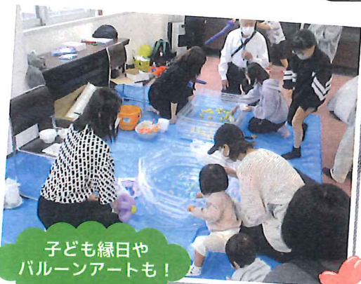
子ども縁日や バルーンアートも!

令和4年9月23日(金祝)に菊水地区会館で、菊水地区福祉のまち推進センターと、菊水地区ネットワーク会議が共催で2年ぶりに開催されました。