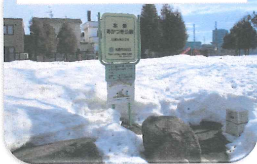
3月18日(土)の公園内雪の状況