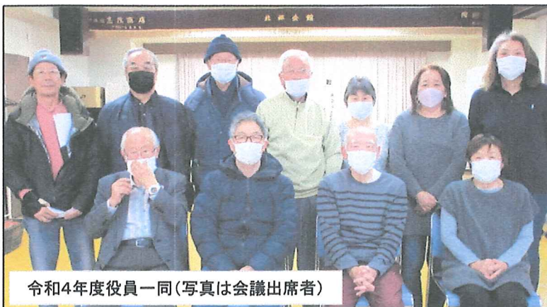
令和4年度役員一同(写真は会議出席者)

令和4年度の諸行事も無事終了することができました。町内会、地域の皆様には各種行事への参加とご協力を頂き、大変ありがとうございました。また区長、班長の皆様には日々、町内会業務で一年間お世話になりました。大変ありがとうございました。