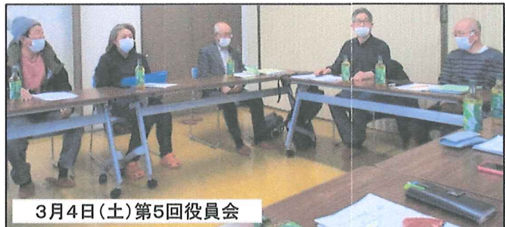
3月4日(土)第5回役員会