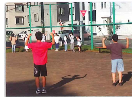
北郷親栄町内会 ラジオ体操