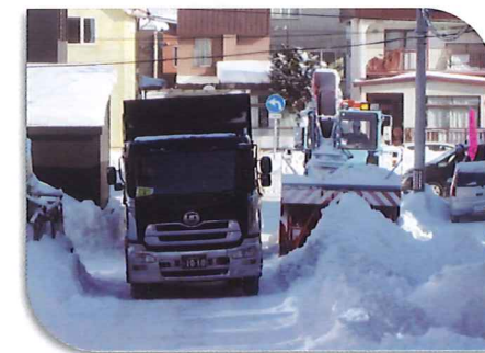
北郷親栄町内会 除排雪作業