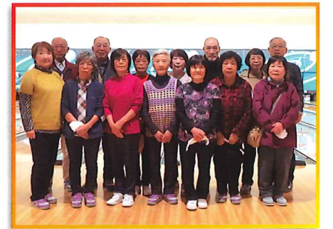
北郷北部町内会 ポーリング大会