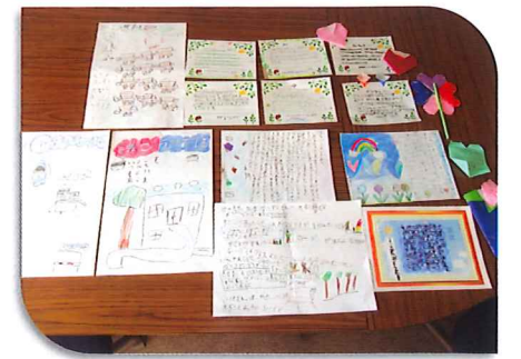
北郷瑞穂町内会 お礼の手紙 (川北小)