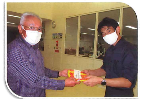
北白石まちネット 防犯グッズ贈呈