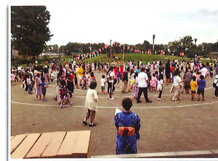
北郷瑞穂町内会 夏祭り