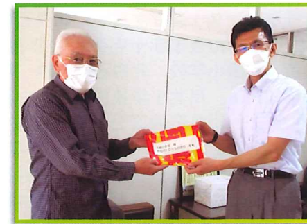
北白石まちネット 防犯グッズ贈呈