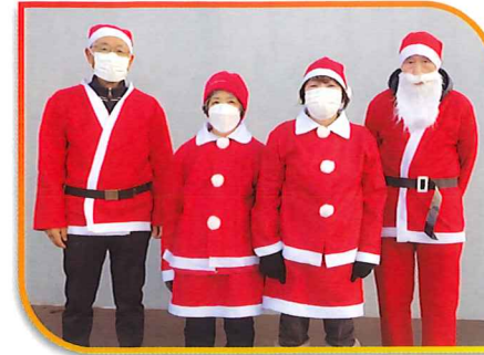
北郷北部町内会 クリスマス