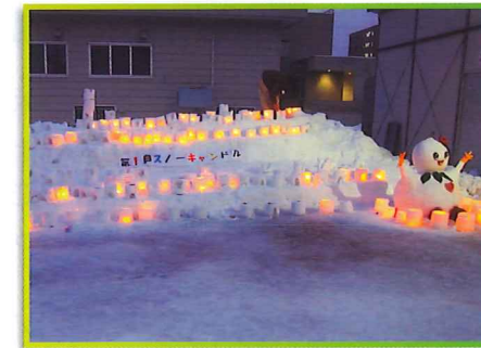
北郷東町内会 スノーキャンドル