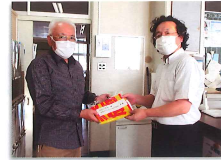
北白石まちネット 防犯グッズ贈呈