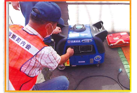
北郷東町内会 避難訓練