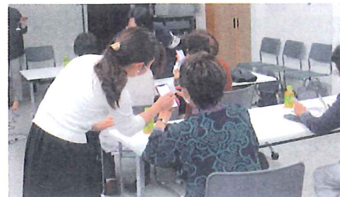
ちょこっと暮らしのサポート講座 一場面 スマホでつながろう (スマホ教室)

本会の令和4年度活動は、住民同士による支え合い活動をより一層充実するため、福祉のまち推進事業、生活支援体制整備事業、ボランティア活動を中心に取り組みました。