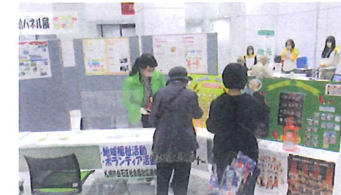
福祉よろず相談会 (区役所地下ホール) ヘルパー事業のパネル展示やボランティアに関する相談コーナーに多数来場いただきました