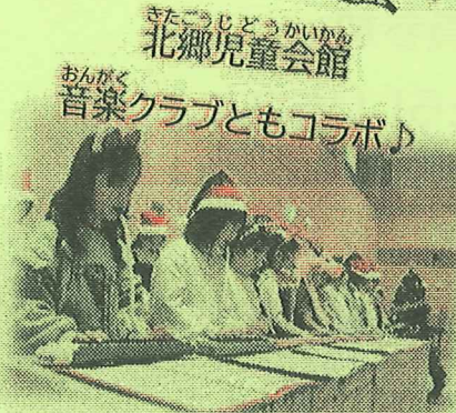
きたごうじ どうかい かん 北郷児童会館 おんがく 音楽クラブともコラボ♪