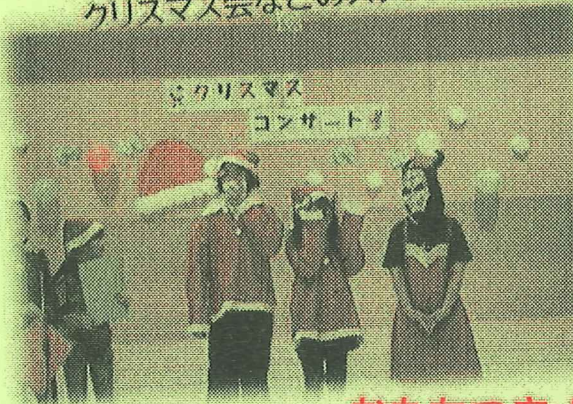
クリスマス コンサート

児童会館で楽しくすごすために、いろんな活動をしているよ! クリスマス会などのスタッフ活動もがんばりました♪