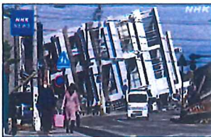
なんとビルが横転！

令和6年1月1日元旦の午後16時10分に能登半島を震源とし、最大震度7の地震発生と4メートルを超える津波が発生して、死者241名、不明者7名、負傷者1188名を数え、地震と津波による住家被害の合計は7万7千棟に及び、現在先ずはライフラインの復旧に国・自治体も全力で取り組んでおり、全国から被災地の復興へ向けて救援の手が差しのべられています、我々も災害時の対応を改めて見直す必要があります。