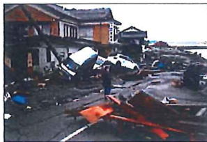
津波による被害も甚大だった