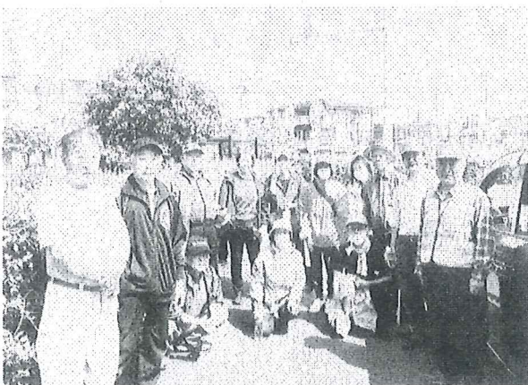
皆さんで花壇づくり、汗を流しました