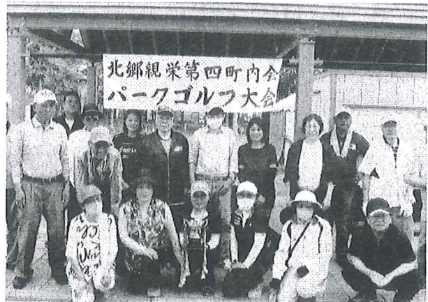
パークゴルフ、皆さん元気一杯がんばりました！