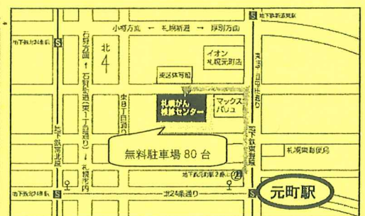
地下鉄東豊線「元町」2番出口から徒歩7分